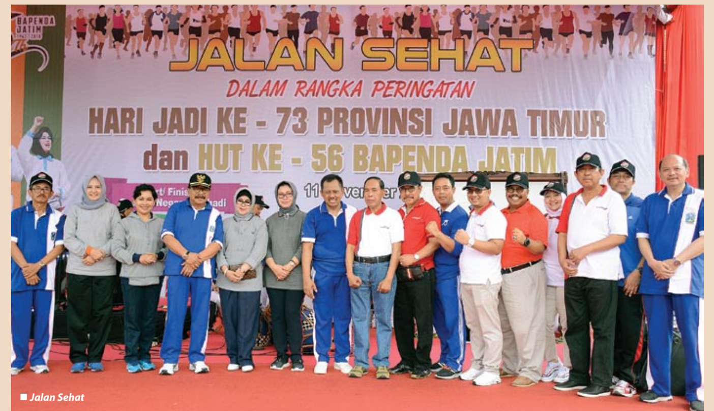
■ Jalan Sehat