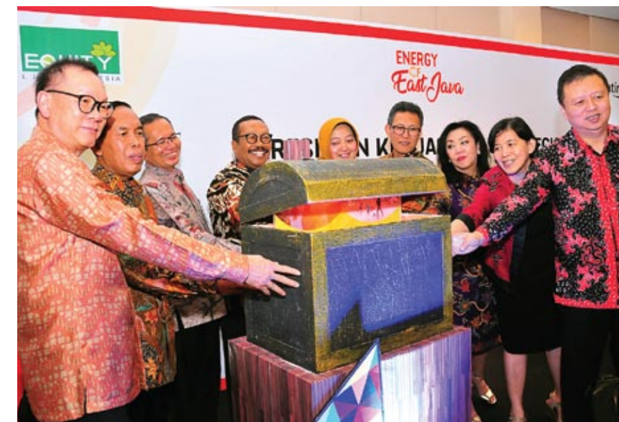
■ Direksi PT Bank Pembangunan Daerah Jawa Timur, Tbk ( bankjatim ) bersama Direksi PT equity life saat peluncuran produk bancassurance

Sementara itu, Asuransi Jiwa Proteksi Multi Investa memberikan manfaat perlindungan seumur hidup dengan kepastian nilai tunai, selain imbal hasil investasi ditambah juga serangkaian manfaat