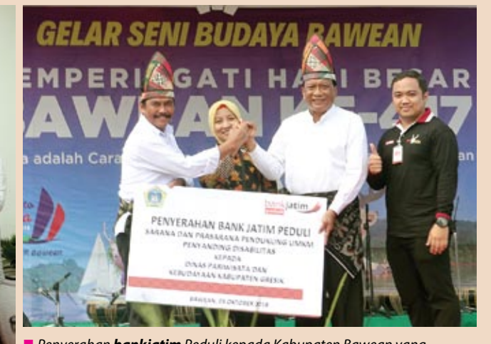
■ Penyerahan bankjatim Peduli kepada Kabupaten Bawean yang diserahkan kepada Bupati Gresik