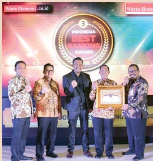
■ bankjatim menerima Indonesia Banking Award