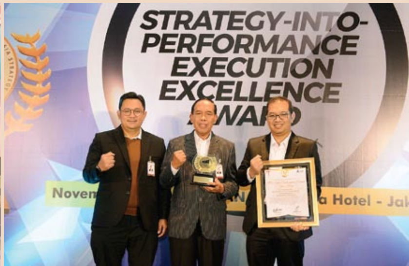
■ bankjatim menerima Strategy into Performance Execution Excellence (SPex) Awards