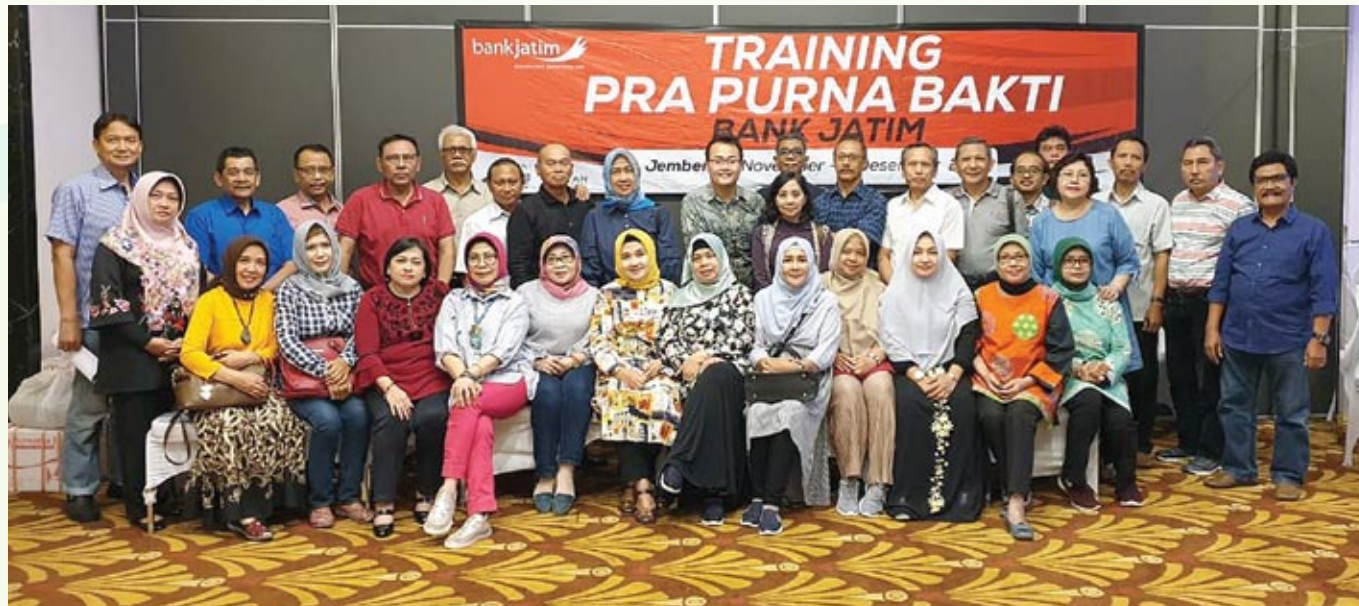
■ Peserta pelatihan Pra Purna Bakti berfoto bersama. Dalam pelatihan ini diajarkan langkah-langkah bagaimana tetap sehat dan sejahtera setelah pensiun.

PADA tanggal 29 November sampai 02 Desember 2018 lalu, Divisi Human Capital bankjatim memberikan Pelatihan Pra Purna Bakti di Jember. Peserta yang berjumlah 25 orang kebetulan memiliki tahun kelahiran yang hampir sama. Sekilas ada yang sudah kelihatan sepuh karena rambut yang sudah memutih sebagian lainnya masih kelihatan segar dan cantik bak usia di bawah lima puluh tahun ( cie..cie..cie.. )