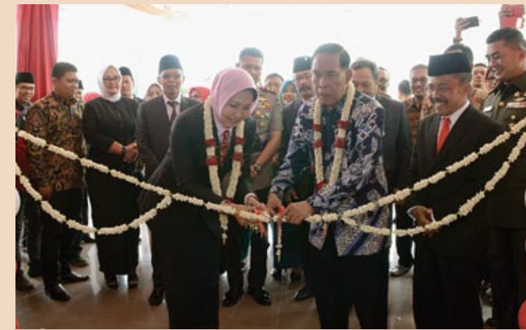
■ Peresmian bankjatim kantor cabang Batu.