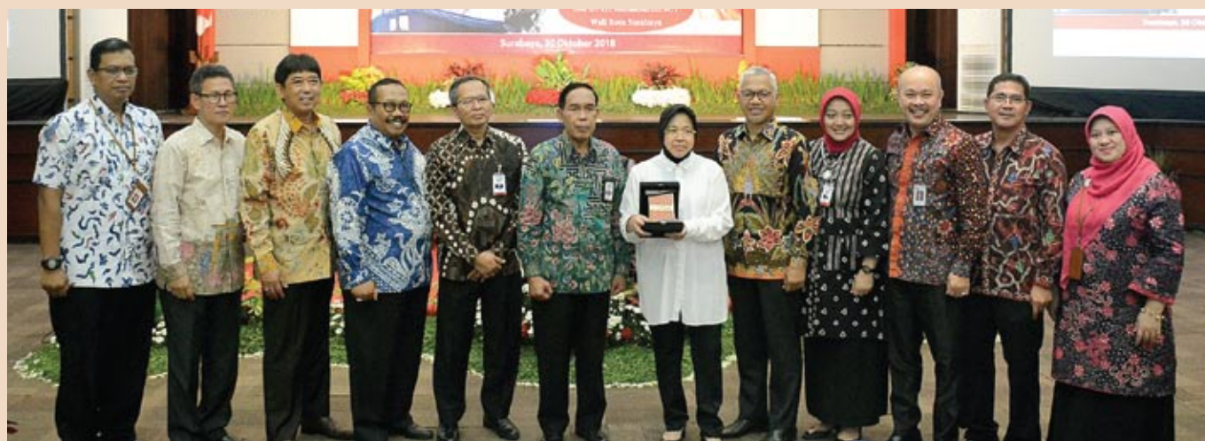
■ bankjatim Economic Outlook 2019