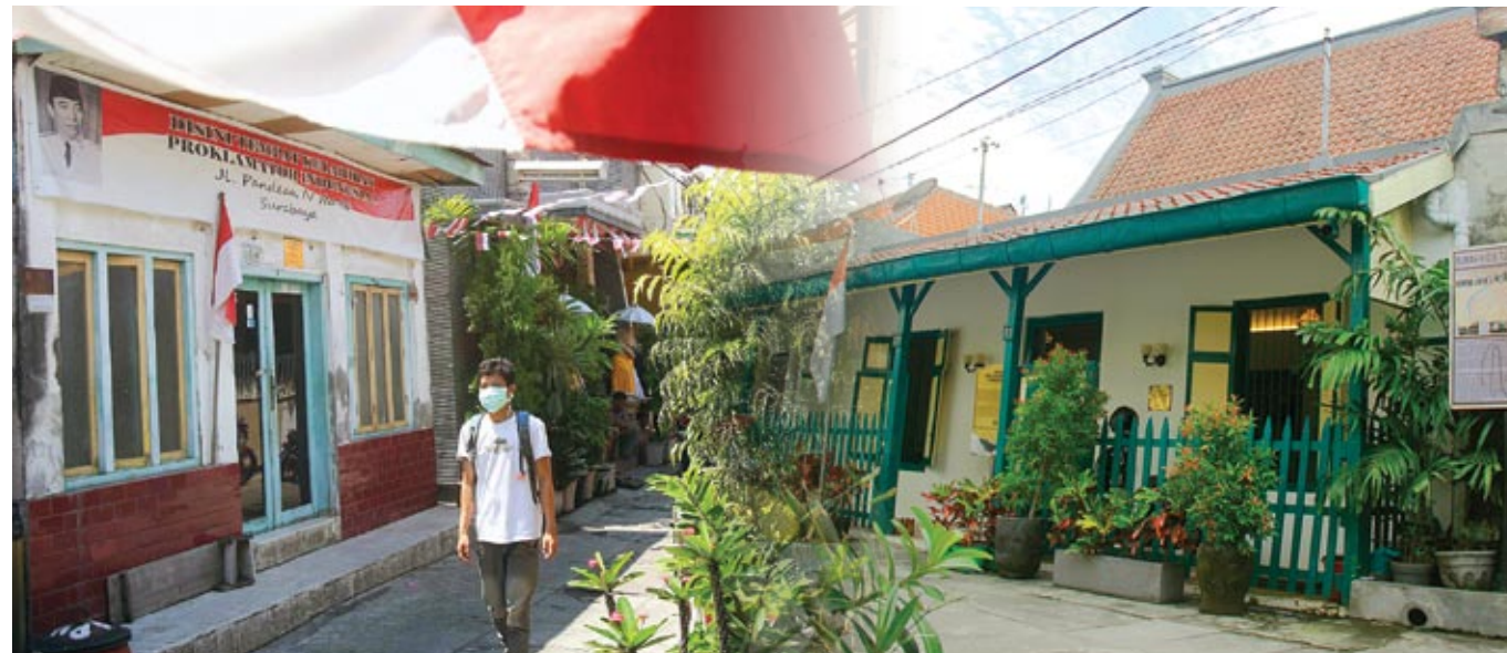
■ Rumah-rumah bersejarah: Rumah tempat Bung Karno dilahirkan (kiri), Rumah HOS Cokroaminoto (kanan).

Kelak, dari penggodokan di rumah kos sederhana itulah, Bung Karno tumbuh menjadi pribadi dengan pemikiran yang bernas dan komplet untuk merintis jalan bagi terwujudnya Indonesia Raya yang sejahtera. ■