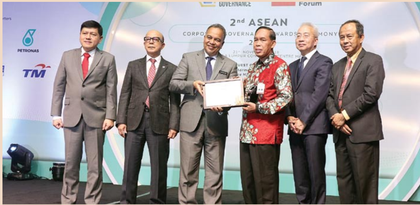
■ bankjatim menerima penghargaan Asean Corporate Governance.