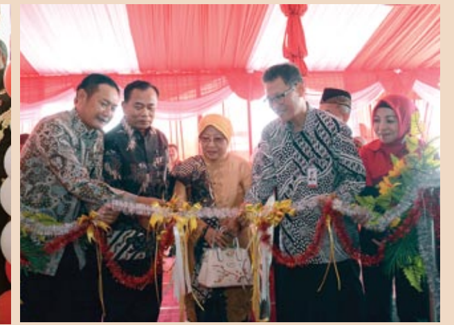
■ Peresmian bankjatim kantor cabang pembantu Brondong, Lamongan