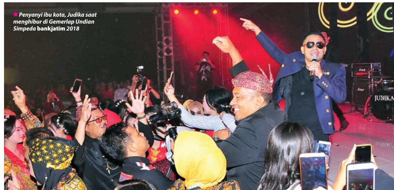
■ Penyanyi ibu kota, Judika saat menghibur di Gemerlap Undian Simpeda bankjatim 2018

Saat Judika tampil, suasana ballroom Shangrila Hotel Surabaya langsung riuh. Apalagi, penampilan Judika cukup atraktif serta mampu berinteraksi dengan undangan. ■