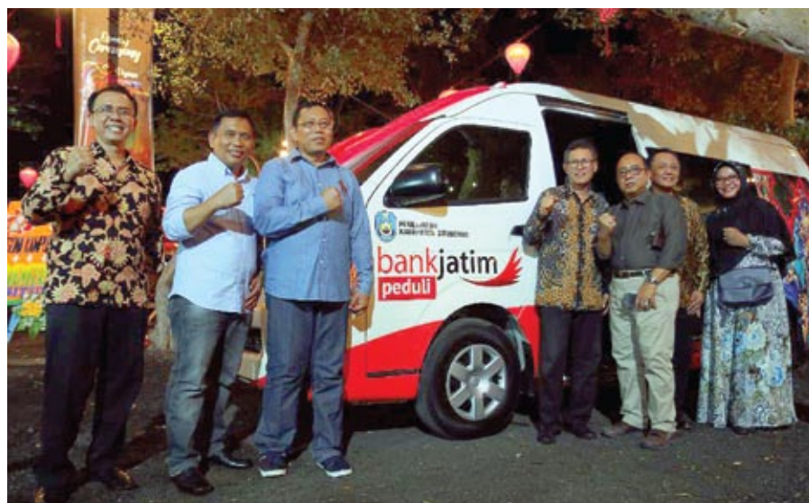
■ Keberadaan mobil shuttle bantuan bankjatim diharapkan bisa ikut membantu mengembangkan wisata di Kabupaten Situbondo

Dunia pariwisata efektif menjadi media penguatan ekonomi di suatu daerah. Dibutuhkan upaya dari berbagai pihak agar destinasi wisata bisa terus berkembang dan diminati wisatawan.