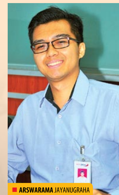
■ ARSWARAMA JAYANUGRAHA