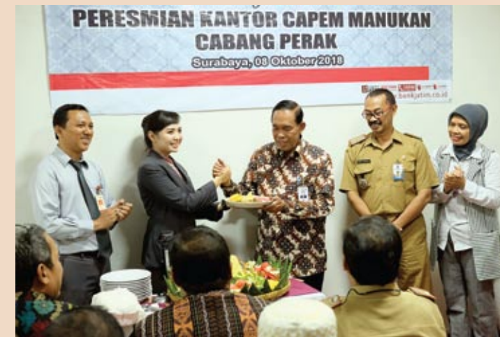
■ Peresmian bankjatim kantor cabang Perak.